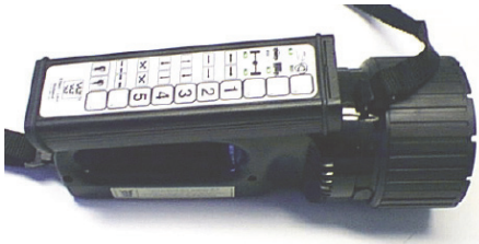
Modell / RF Programmierbare Funkfernbedienung VLT 9033/PR/RF - VLT 9036/PR/RF