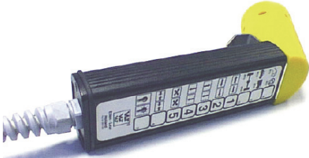
Modell /CR Programmierbare Fernbedienung mit Kabel VLT 9033/PR/CR - VLT 9036/PR/CR

Mit unserer Gelenkspielprüferserie für Pkws und Kleinlaster bieten wir unseren Kunden ein Qualitätsprodukt mit allen Möglichkeiten, um in kurzer Zeit Spiel und Verschleiß zu überprüfen.